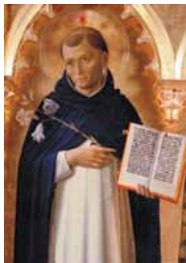
Święty Dominik, Fra Angelico, Perugia, Włochy

(Orędzie Ojca Świętego Franciszka na Wielki Post 2014 roku)