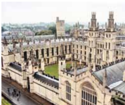
Uniwersytet w Oksfordzie