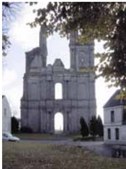
Ruiny opactwa w Mont-Saint-Éloi, zrujnowanego w czasie akcji dechrystianizacyjnej