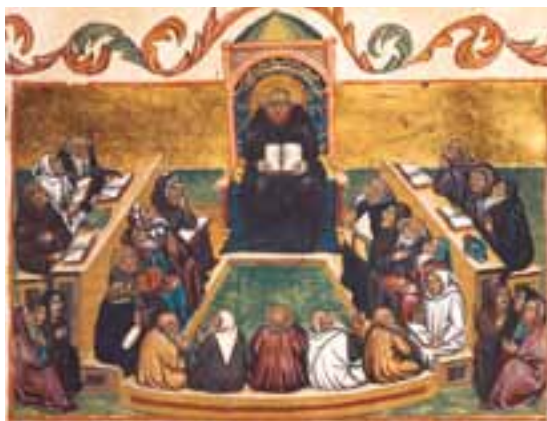
Benedykt przedstawia mnichom swoją Regułę , Mantua, Włochy.

O zwoływaniu braci na radę. Ilekroć trzeba w klasztorze podjąć jakąś ważną decyzję, niechaj opat zwoła całą wspólnotę i przedstawi jej, o co chodzi. Wysłuchawszy opinii braci, niech ją sam rozważy, a następnie zrobi to, co uzna za bardziej wskazane.