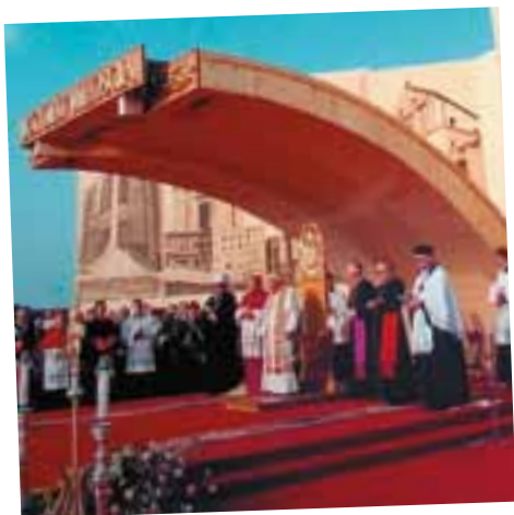
Spotkanie ekumeniczne w Drohiczynie podczas pielgrzymki Jana Pawła II do Polski w 1999 r.

Kościół katolicki i prawosławny podejmują różnego rodzaju działania ekumeniczne. Niezwykle istotne było zdjęcie wzajemnych ekskomunik przez papieża Pawła VI i patriarchę Atenagorasa I w 1965 r.