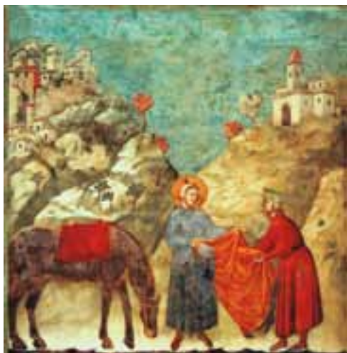
Święty Franciszek ofiarowuje płaszcz ubogiemu rycerzowi, Giotto di Bondone, XIII w., Asyż, Włochy

Życie według zasad ewangelicznych było wpisane w regułę zakonu założonego przez św. Franciszka. Nakazywała ona wierne naśladowanie Jezusa Chrystusa, szczególnie przez pokorę i ubóstwo. Bracia mieli się utrzymywać z pracy i – w miarę potrzeby – z jałmużny oraz zrezygnować z wszelkiej własności (zarówno osobistej, jak i wspólnotowej). Szczególnym rysem nowej wspólnoty było połączenie modlitwy kontemplacyjnej z działalnością apostołską i misyjną.