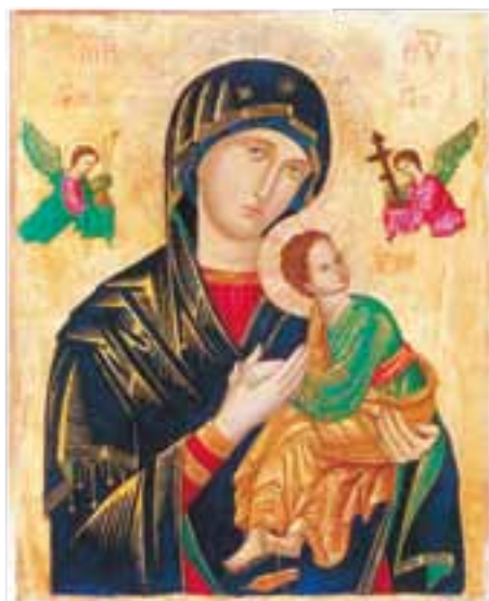
Ikona Matki Bożej Nieustającej Pomocy

W Kościele katolickim bardzo mocno zakorzenił się kult Matki Bożej Nieustającej Pomocy. Jest to typ ikony zwanej Hodegetria , co oznacza: „wskazująca drogę”, bo Maryja wskazuje na Chrystusa, który sam siebie nazwał „Drogą, Prawdą i Życiem”. Choć ikony są charakterystyczne dla Kościoła wschodniego, ta ikona Matki Bożej znajduje się w wielu kościołach i domach katolików. To jeden z elementów, który nas jednoczy.