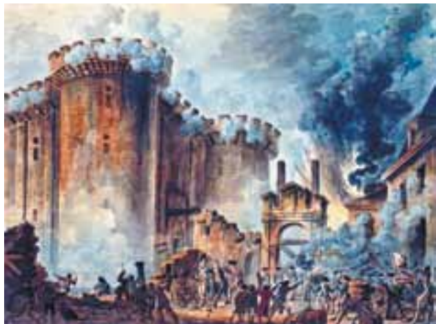
Szturm na Bastylię 14 lipca 1789 roku, Jean-Pierre Houël, Paryż, Francja

wprowadziła równość wobec prawa, wolność słowa i wyznania (oficjalnie, w rzeczywistości miała to być „wolność od wyznawania jakiegokolwiek wiary”), doprowadziła burżuazję do władzy. Jej idee wywarły ogromny wpływ na całą Europę, przyspieszając proces tworzenia się nowoczesnych państw narodowych. Jednocześnie rewolucja doprowadziła do śmierci bar-