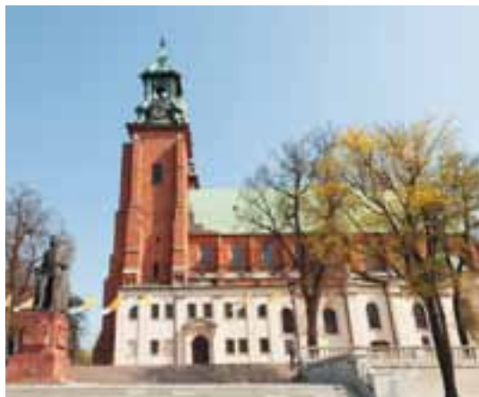
Bazylika archikatedralna Wniebowzięcia NMP, Gniezno, IX w., Polska