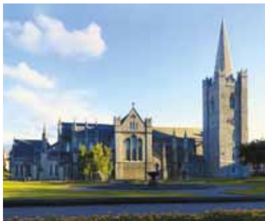
Katedra św. Patryka w Dublinie, XII w., Irlandia