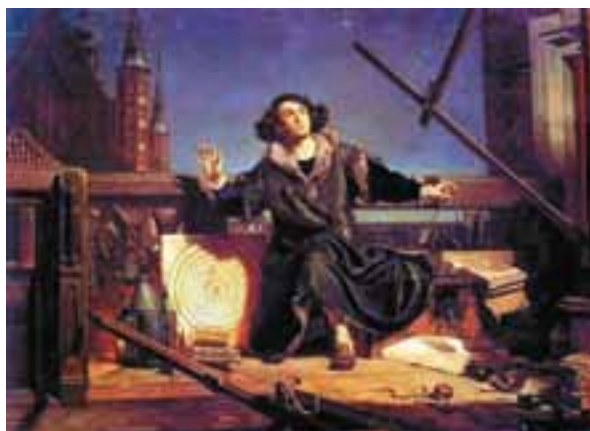
Astronom Kopernik, czyli rozmowa z Bogiem, Jan Matejko, 1873, Kraków

Na średniowiecznych uniwersytetach europejskich studiowało wielu Polaków. Zdobytą wiedzę wykorzystywali dla dobra Kościoła i Polski, a tym samym dla dobra konkretnych ludzi żyjących ówczesnie. Owoce ich dziedzictwa trwają do dziś. Na przykład dzieło Mikołaja