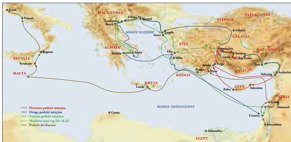
Mapa podróży misyjnych św. Pawła

Areopag, gdzie św. Paweł wygłosił swoją mowę, przeszedł do historii jako miejsce spotkania wielu kultur i religii. Ateńczycy gromadzili się na nim, aby posłuchać różnych nowin. Było to również miejsce posiedzeń przedstawiciele rady miejskiej. Choć można odnieść wrażenie, że Paweł poniósł klęskę w rozmowie z filozofami, to jednak spotkanie to było bardzo ważne. Było to pierwsze wystąpienie św. Pawła w miejscu publicznym, skierowane do szerokiego kręgu słuchaczy.