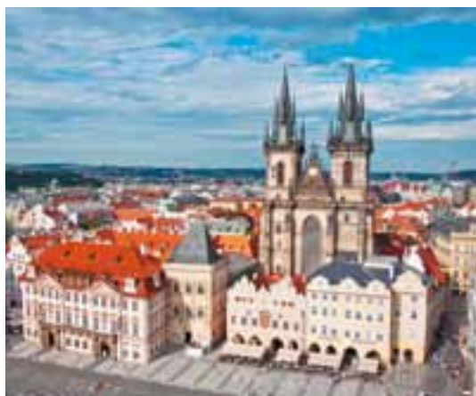
Kościół NMP przed Tynem w Pradze, od XI w., Czechy