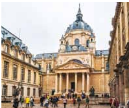
Uniwersytet Paryski – Sorbona

Wśród uniwersytetów, które powstały w średniowieczu, należy jeszcze wymienić uniwersytety w Tuluzie (Francja), w Padwie i Neapolu (Włochy). Ważnymi ośrodkami