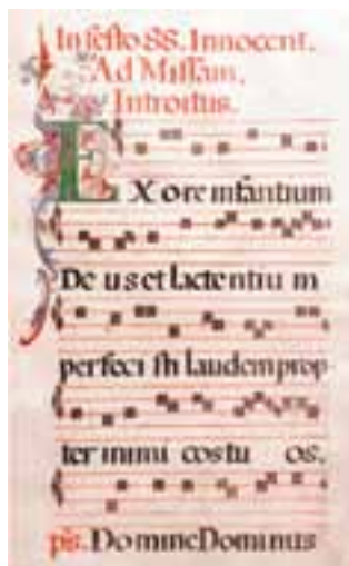
Karta z chorałem gregoriańskim

ważności kanonów prawa kościelnego, dokonywania zmian granic diecezji. Rządził Kościołem silną ręką, bezpośrednio wpływając poprzez swych legatów na sprawy Kościołów lokalnych (m.in. za jego zgodą odbudowano w Polsce struktury metropolii gnieźnieńskiej, zniszczone wskutek reakcji pogaństwa w latach 30. XI w.). Dzięki reformie gregoriańskiej zostały ustanowione nowe zasady wyboru papieża. Nie był już wybierany przez duchowieństwo i lud (jak w starożytności), ani przez cesarza (jak bywało w IX–XI w.), lecz przez kardynałów, jak dzieje się to do dzisiaj.