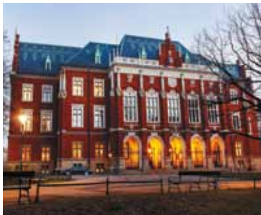
Uniwersytet w Krakowie

ja Kopernika zmieniło postrzeganie wszechświata i rozślawiło Polskę na cały świat. Na jego odkryciach opiera się wiele współczesnych nauk. Natomiast wielki wpływ na sytuację polityczną, kulturową i religijną w Polsce miała działalność Mikołaja Trąby, Stanisława Hozjusza czy Zbigniewa Oleśnickiego.