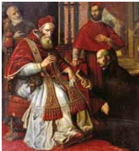
Ignacy Loyola przedstawia papieżowi Regulę , XVI w., Rzym, Włochy

W 2017 r. upłynie 500 lat od początku reformacji. Zarówno Kościół katolicki, jak i wspólnoty protestanckie chcą wykorzystać ten fakt do poszukiwania