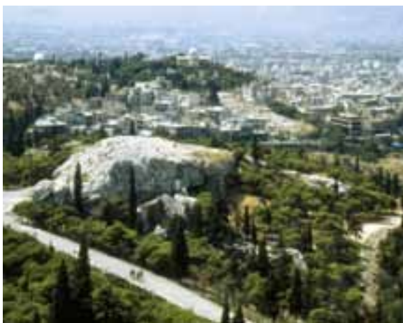
Areopag, Ateny, Grecja

WARTO być obecnym na współczesnych areopagach